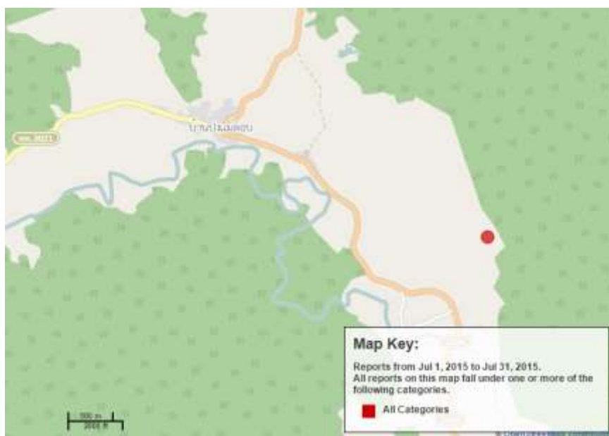
แผนที่แสดงจุดที่มีสถานการณ์การชุมนุมหรือมีการจัดกิจกรรมสาธารณะในพื้นที่จังหวัดลำพูน